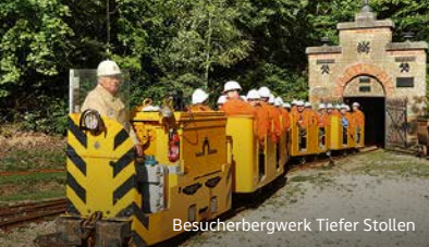
Besucherbergwerk Tiefer Stollen